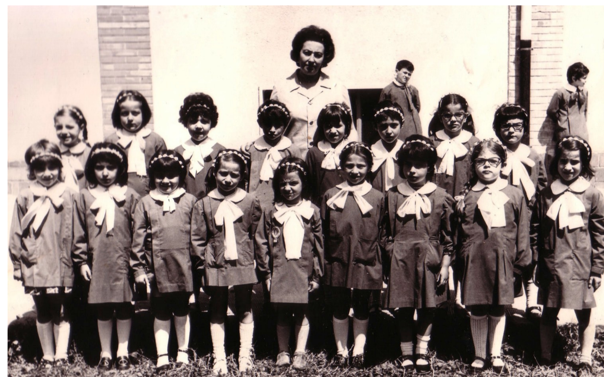
Avellino. Scuola elementare San Tommaso, 1971

La legge 517 del 4 agosto 1977 mette fine alle classi differenziali e dà vita alla figura dell'insegnante di sostegno.